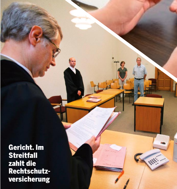
Gericht. Im Streitfall zahlt die Rechtsschutzversicherung