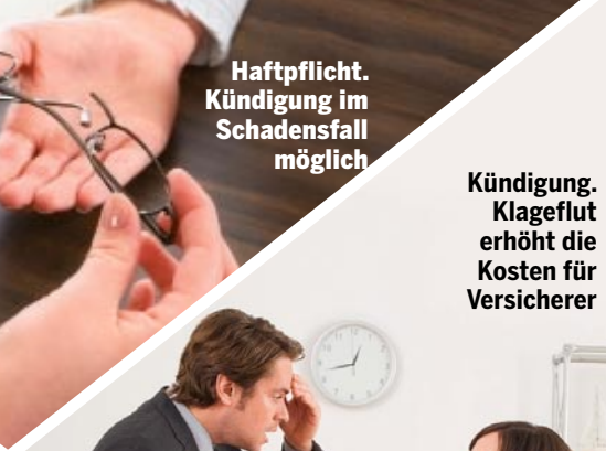
Haftpflicht. Kündigung im Schadensfall möglich