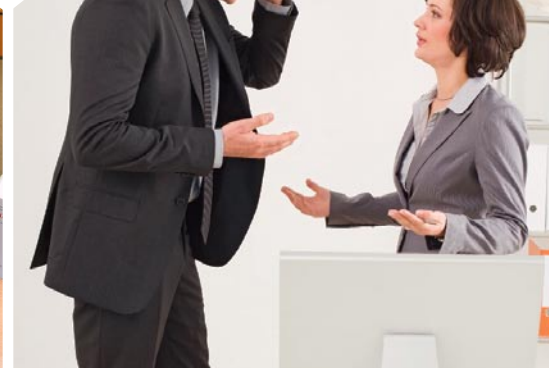
Kündigung. Klageflut erhöht die Kosten für Versicherer